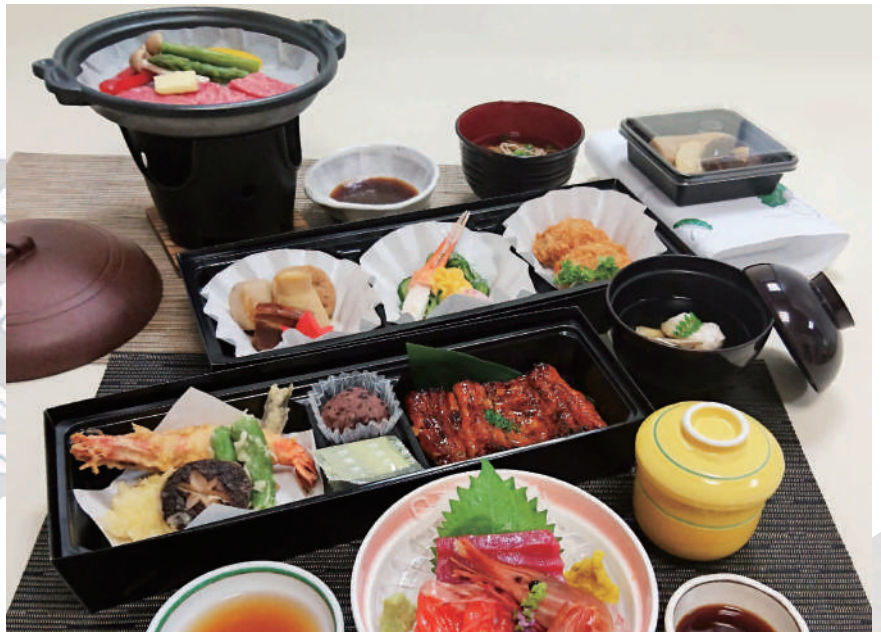
⑪ 仙台牛陶板・鰻蒲焼 8,000円(消費税別)