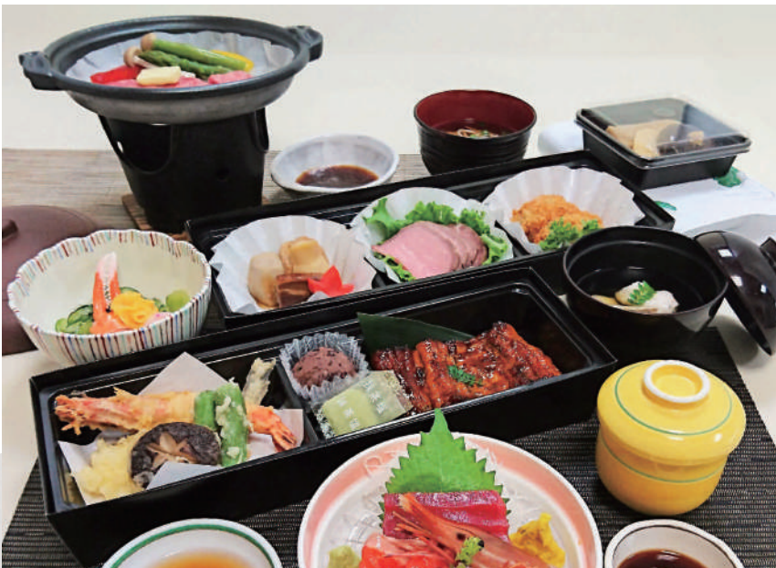
⑫ 仙台牛陶板・鰻蒲焼・ローストビーフ 9,000円(消費税別)