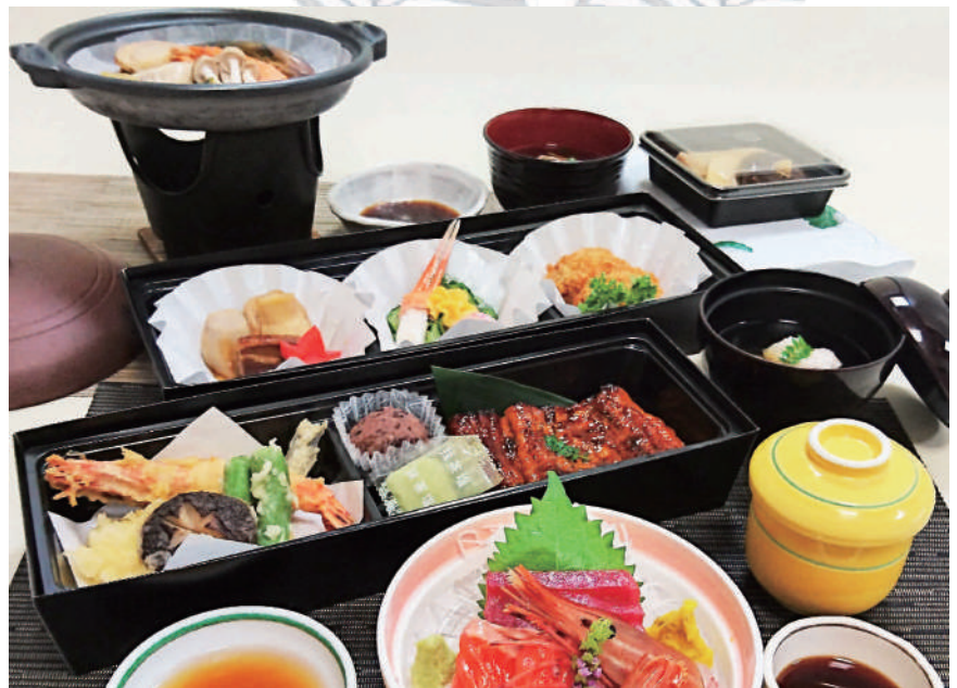
⑧ 海鮮陶板・鰻蒲焼 7,000円(消費税別)