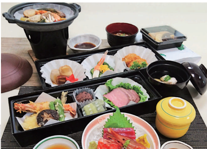
⑨ 海鮮陶板・ローストビーフ 7,000円(消費税別)