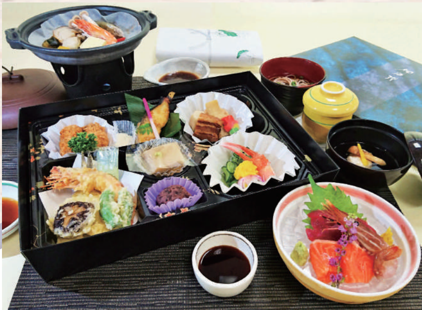
⑦ 海鮮陶板 6,500円(消費税別)